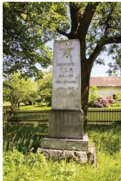
Bučávka na Osoblažsku