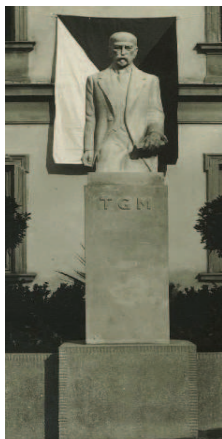
První pomník (1938)