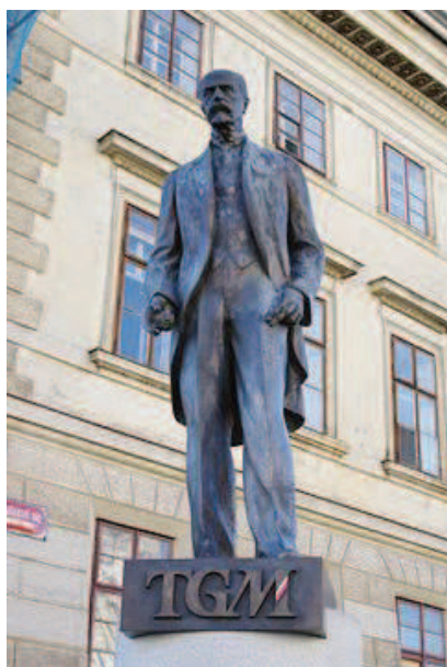
Praha – Hradčany