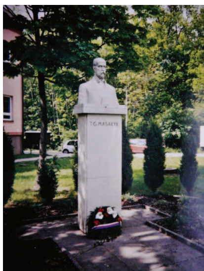
Újezd nad Lesy